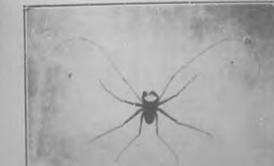
Ejemplar de "phrynus americanus", capturado por los boyscouts de Marianao en reciente excursión científica.