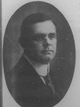
RAMON LEOCADIO BONACHEA. Consul de Cuba en Halifax y una de las figuras más prestigiosas del Cuerpo Consular cubano.

Es "Bohemia" una amena y interesante publicación, que por su fondo y forma hace honor a la prensa costarricense.