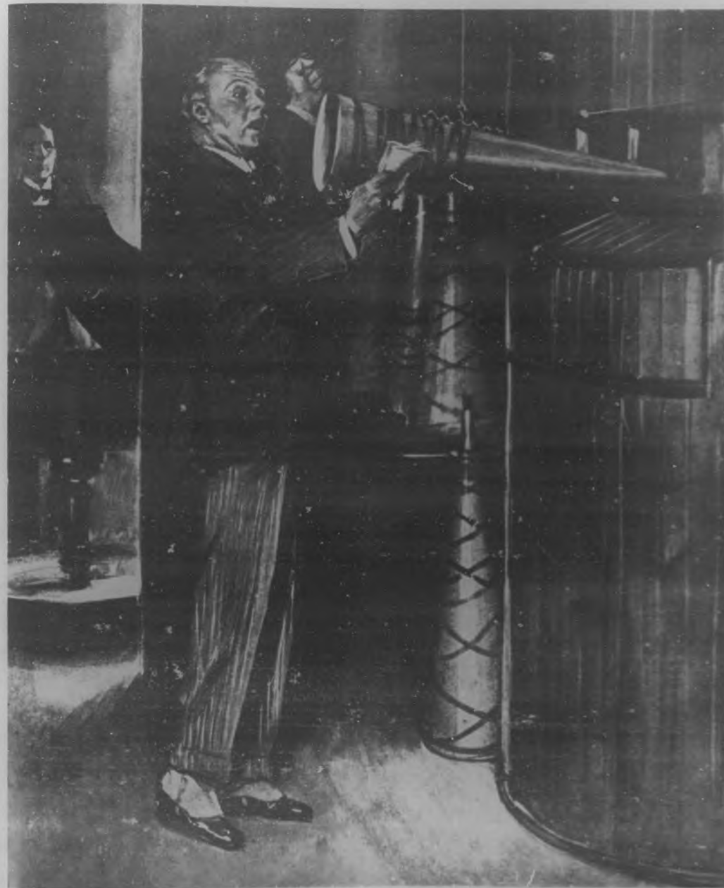
UN NUEVO INSTRUMENTO DE EDUCACION POLITICA.—Un orador inglés pronunciando un discurso ante el receptor de un gramófono, discurso que después de impreso en discos, servirá para contribuir a la educación cívica del pueblo.