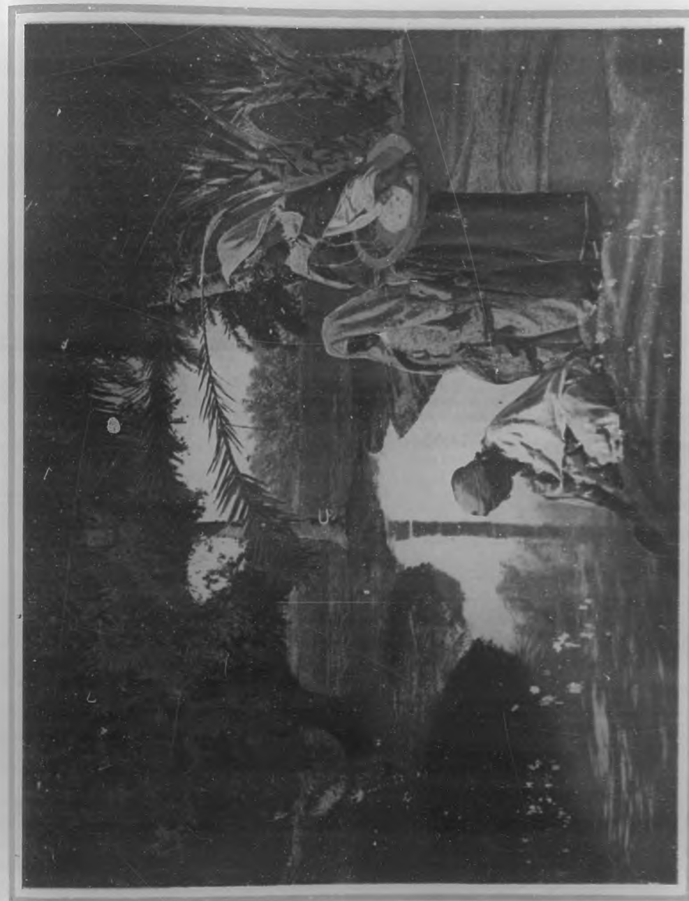
(Grabado tricolor de BOHEMIA)

Y que allí nos queda un como bastuante ideal de todos nuestros idealismos. (Pasa a la Pág. 22.)