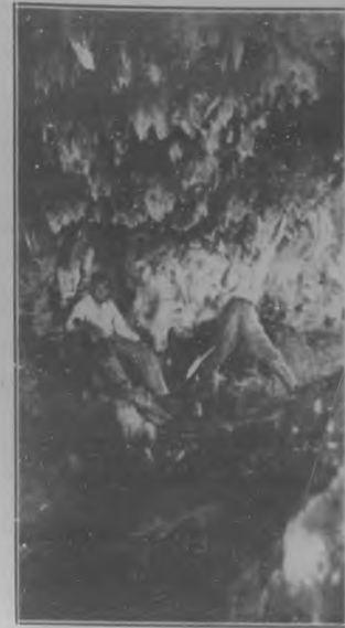
Dos boyscouts de Marianao, bajo las estalactitas de la caverna "Herrera".